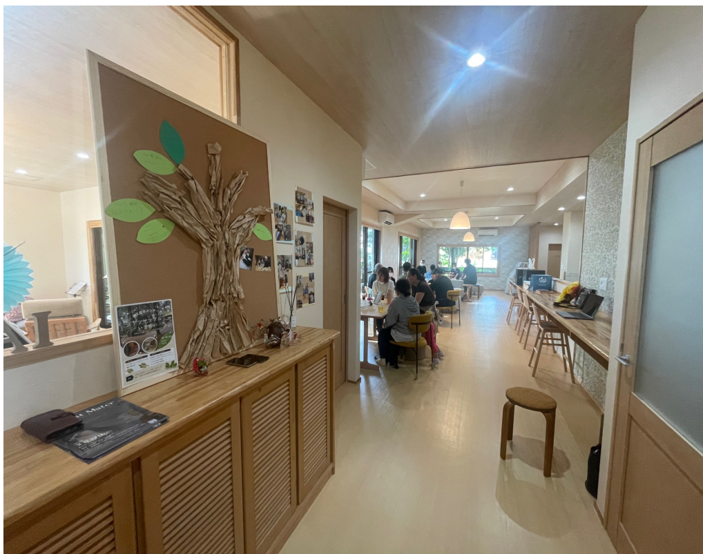
グリーンサークル「虹の会」