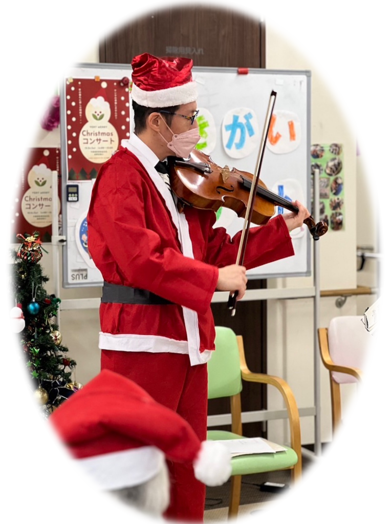
趣味：ヴァイオリン・ヴィオラ演奏 訪問演奏 いのちの授業