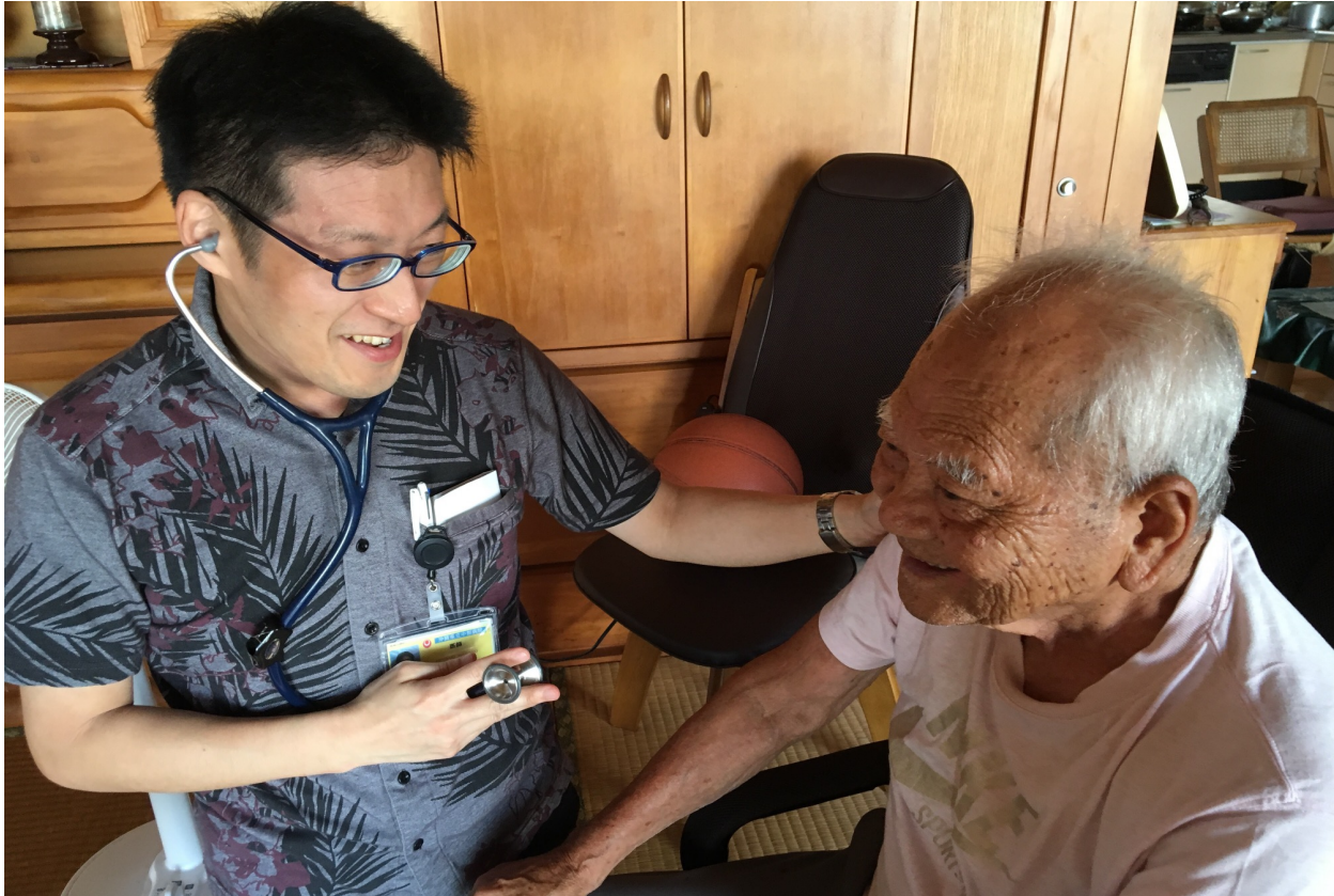
総合内科専門医・呼吸器内科専門医/指導医

奈良県出身 2006年 岡山大学卒業 沖縄県立中部病院 呼吸器内科・地域ケア科 医長 2023年 沖縄県沖縄市に いきがい在宅クリニックを開業 2024年 シェアハウス型在宅ホスピス「いきがいの家」