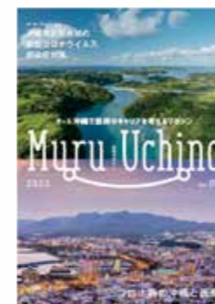
Muru Uchina 2022 Vol.09

沖縄県地域医療支援センターが発行している情報誌『Muru Uchina ムルウチナー』で北部地域の特集記事が掲載されました。下記リンクからご参照ください。