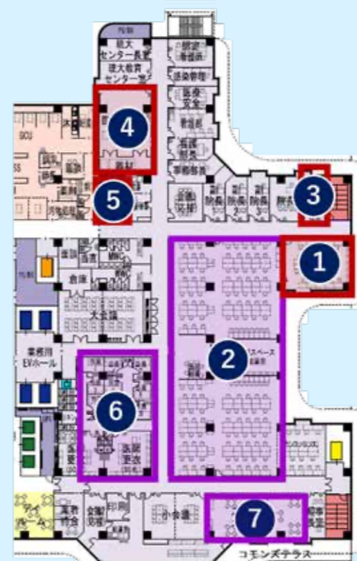
4階 平面図 管理エリア (予定)