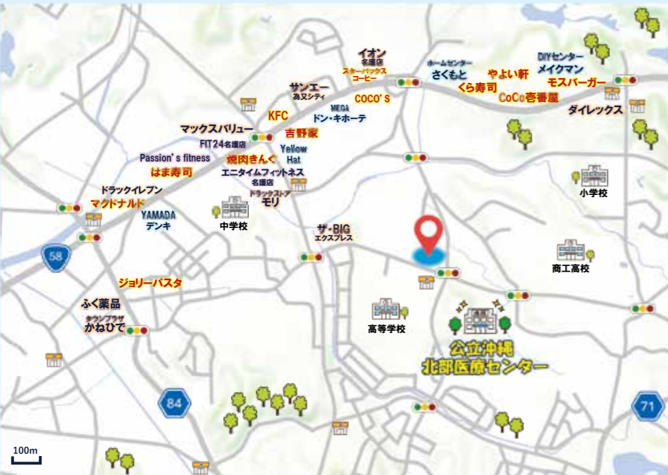
「地理院地図」淡色地図を加工して作成