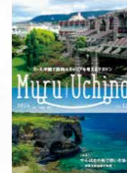
Muru Uchina 2024 Vol.12