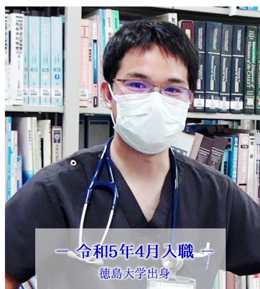
— 令和5年4月入職 — 徳島大学出身