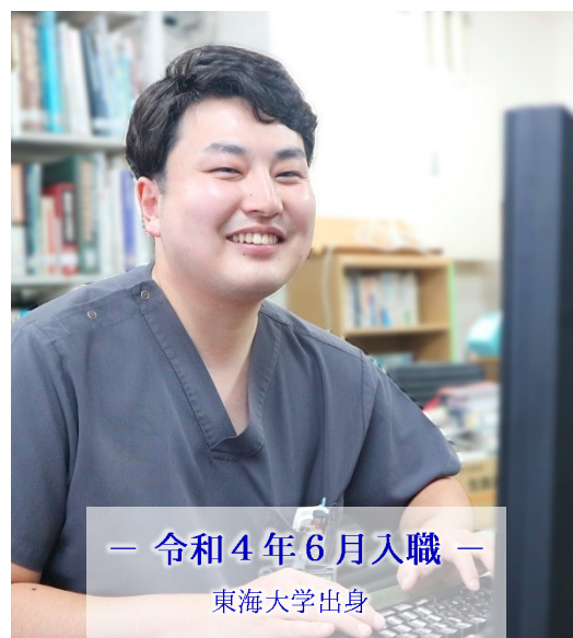
— 令和4年6月入職 — 東海大学出身