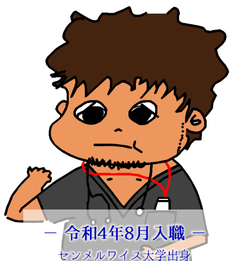
— 令和4年8月入職 — センメルワイス大学出身